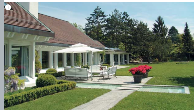
1 Den Übergang vom Wohnzimmer in den Garten hinaus begleitet ein langes, schmales Zierbecken mit stillem Wasser. 2 3 Die Beleuchtung setzt den Garten in Szene und macht ihn auch bei Nacht zum Lebensraum.